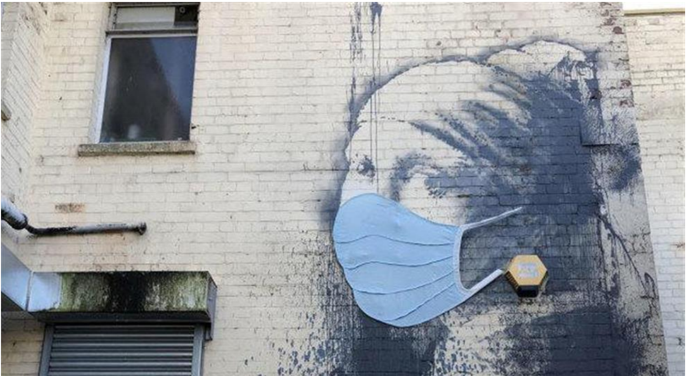
Banksy, graffito urbano raffigurante La ragazza con l'orecchino di perla ai tempi del coronavirus, Bristol (UK)